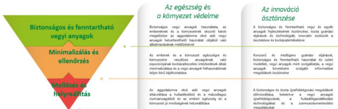
Ábra: A toxikus anyagoktól való mentesség hierarchiája – a vegyi anyagok kezelésének új hierarchiája

A szóban forgó stratégia meghatározza e jövőkép megvalósítása felé vezető utat, mégpedig az alábbiakra irányuló intézkedések révén: a biztonságos és fenntartható vegyi anyagokra irányuló innováció támogatása, az emberi egészség és a környezet védelmének erősítése, a vegyi anyagokra vonatkozó jogi keret egyszerűsítése és megerősítése, a tényeken alapuló szakpolitikai döntéshozatalt támogató átfogó tudásalap kiépítése, valamint világviszonylatban példamutatás a vegyi anyagok megfelelő kezelése terén.